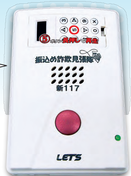
振り込め詐欺見張隊 新117

「この電話は、振り込め 詐欺などの犯罪被害 防止のため、会話内容が 自動録音されます。」