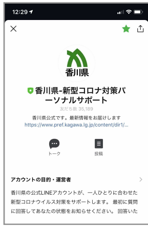
①香川県LINE公式アカウントに友だち登録