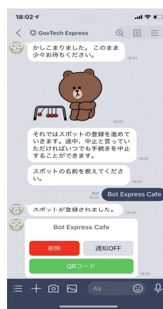
③店舗名称等の質問に回答していくとQRコードを掲載した様式が発行されます。