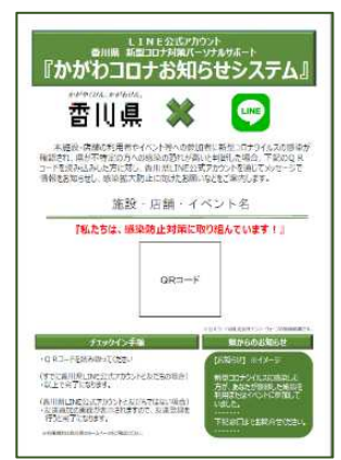
④印刷して店舗等に掲示してください。