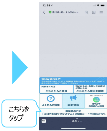
②トーク画面下部の『事業者の方のコロナお知らせシステムのQRコード申請はこちらから』をタップ。