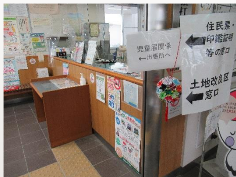
▲高松市役所弦打出張所

和室、調理実習室、小会議室、大会議室をお使いいただけます。(原則、有料。※使用条件あり) 詳しくはホームページをご覧になるか事務室にお問合せください。