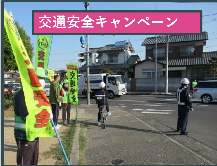
交通安全キャンペーン