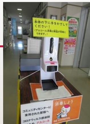
▲検温機能付き 手指消毒機