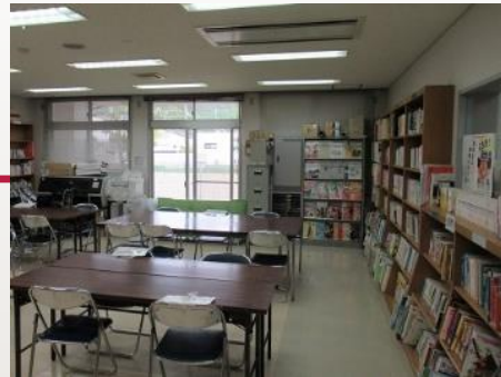
▲図書室 蔵書数 約2,400冊 児童・大人向け