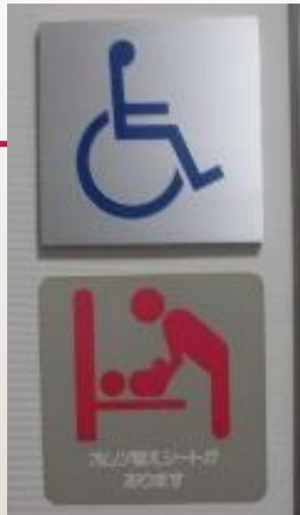
▲車椅子、おむつ 替え対応トイレ